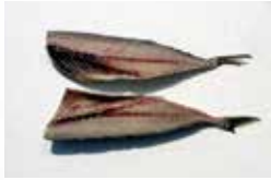
■ サバ ■