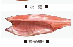
■ 養殖銀鮭 ■