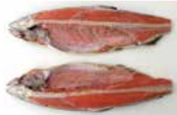
■ 新巻 ■