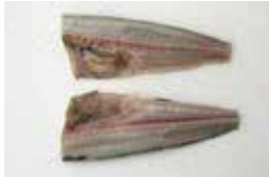
■ ホッケ ■