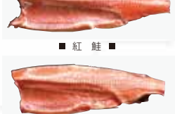
■ 紅 鮭 ■