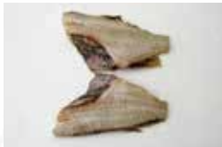
■ 赤魚 ■