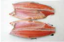
■ トラウト ■