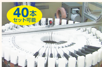
包丁をターンテーブルにセット