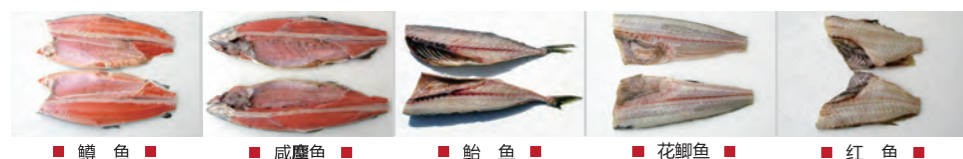
■ 鲭 鱼 ■ ■ 咸 麩 鱼 ■ ■ 鲈 鱼 ■ ■ 花 鲫 鱼 ■ ■ 红 鱼 ■

各种鲑鱼 秋鲑、鲭鱼、红鲑、养殖银鲑鱼、大西洋鲑鱼、咸鲑鱼等 鲈鱼、鲷鱼、花鲫鱼、红鱼 等