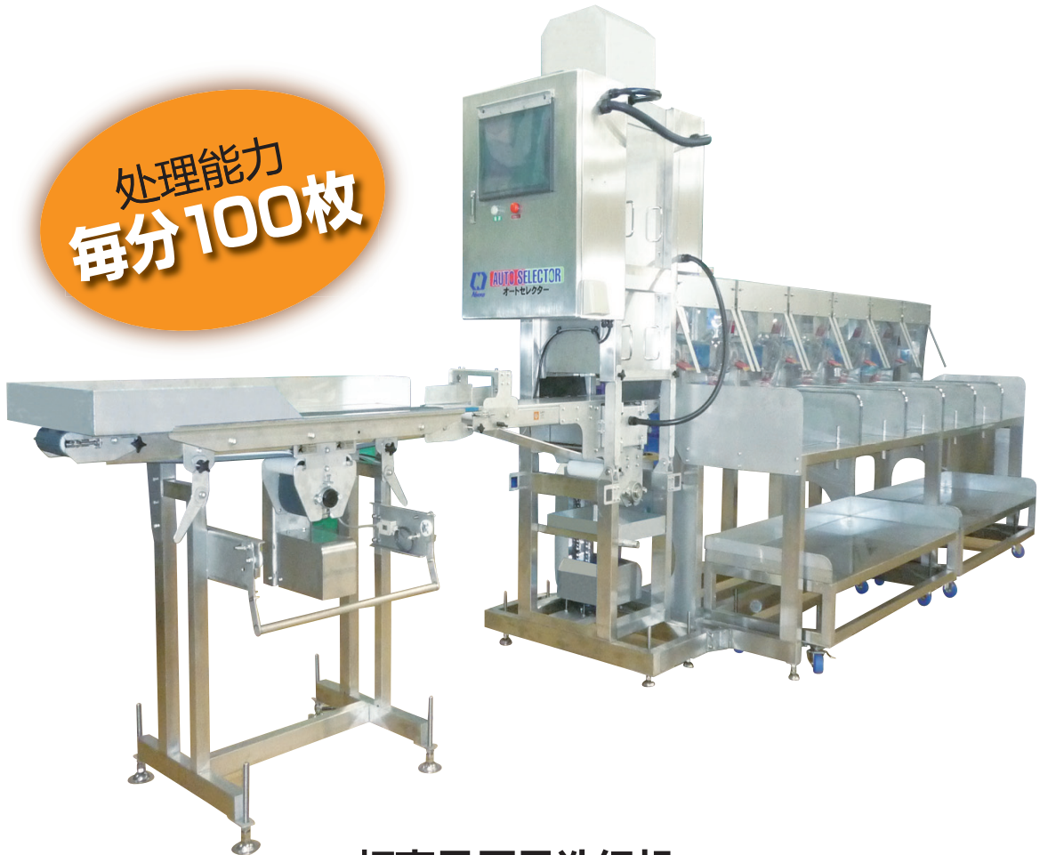
虾夷贝原贝选级机